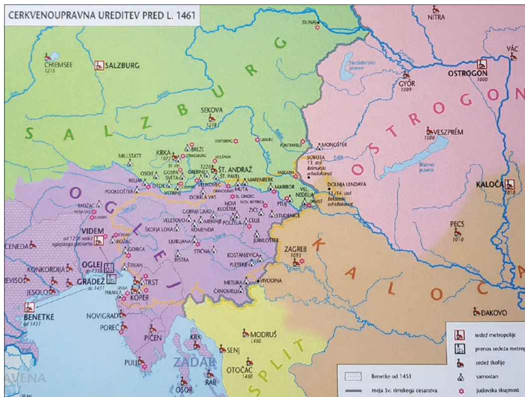
Cerkvenoupravna ureditev pred letom 1461 (Slovenski zgodovinski atlas, str. 82).