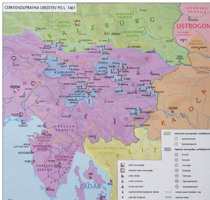
Cerkvenoupravna ureditev po letu 1461 (Slovenski zgodovinski atlas, str. 100).

skega škofa in menzi ljubljanskega stolnega kapitlja, vrsta župnij kostanjeviški in stiški cisterci, nekatere leta 1493 ustanovljenemu kolegiatnemu kapitolju v Novem mestu, v Beli krajini pa je nemški viteški red oblikoval lasten manjši arhidiakonot. 9 Na terenu je torej vladala precejšnja zmeda, med omenjenima opatom in novomeškimi prosti je nenehno prihajalo do sporov, zato je bilo treba razmerje med arhidiakonati nujno vzpostaviti na novo. 10 Po dolgoletnih sporih sta bila konec 17. stoletja vendarle ustanovljena kostanjeviški in stiški arhidiakonot. 11 Veliko večji problem so pomenile zahteve novomeških proštov. Ti so si, potem ko so postali dolenski arhidiakonot, pričeli laštiti določene pravice do župnij obeh samostanov. Želeli so si namreč vso duhovno oblast nad samostanskimi župnijami in njihovo župnijsko duhovščino, razen seveda tiste, ki je pripadala krajevemu škofu. Večji spori med obema samostanoma in novomeškimi prosti so izbruhnili v začetku 17. sto-