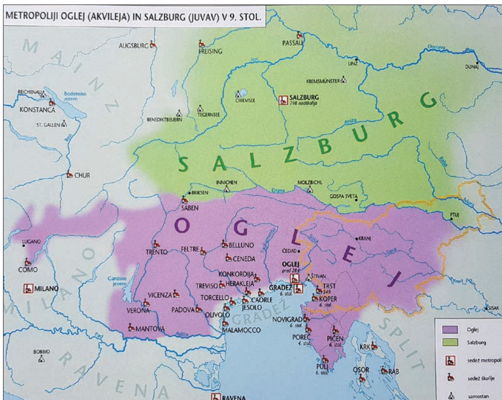
Metropoliji Oglej in Salzburg v 9. stoletju (Slovenski zgodovinski atlas, str. 56).