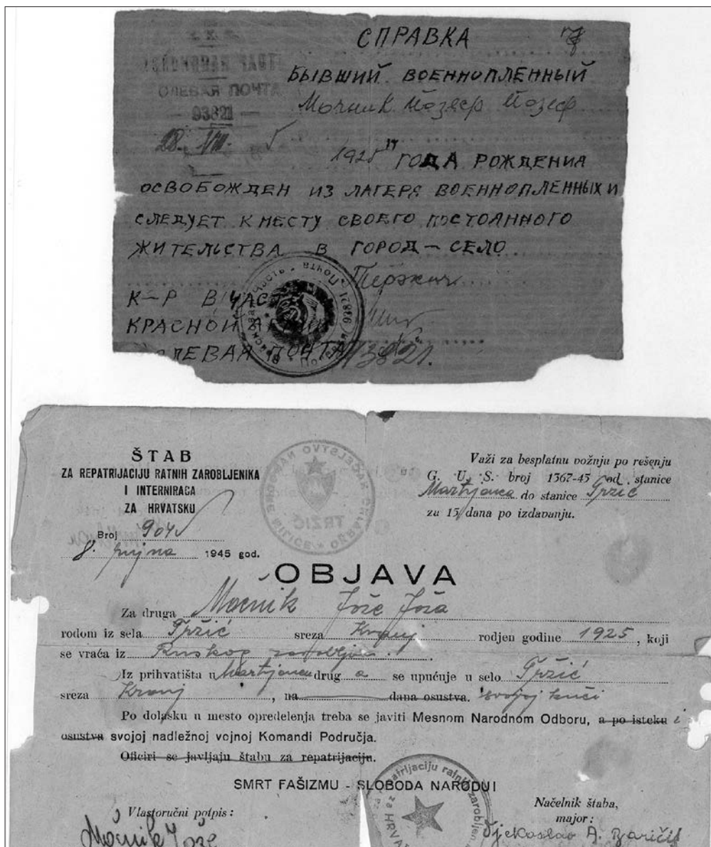
Spravka (dokument o odpustu) iz taborišča v Sovjetski zvezi in objava (dokument o napotitvi) iz repatriacijske baze v Martjancih na Hrvaškem, september 1945 (brani: družina Močnik, Tržič).

da »kontrolirate navedene podatke, če odgovarjajo resnici in kontrolirate njihovo bivališče. O izvršitvi te naloge nam poročate.« 68