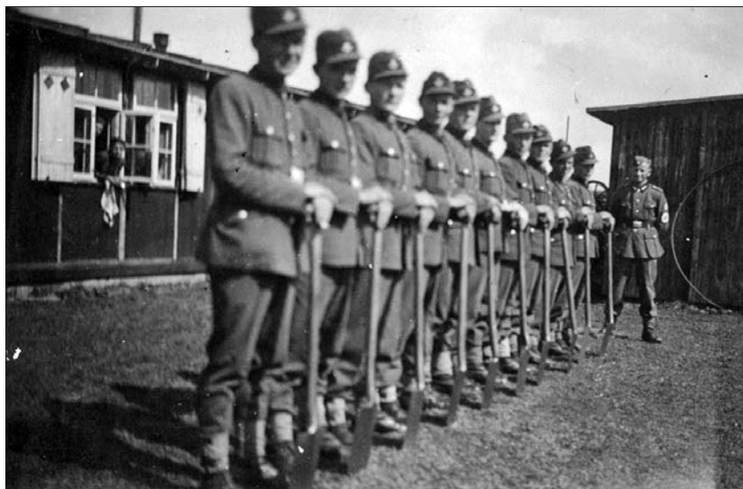
Tržičani v RAD taborišču v kraju Alberschwende pri Bregenzu, 1943.

nik ne bo odzval vpoklicu, kaznovan ne samo vojaški obveznik, ampak tudi njegova družina, ki bo izgnana, imetje pa zaplenjeno. Kaznovani pa ne bodo tisti, ki jih bodo partizani odpeljali na silo in bodo izkoristili prvo priložnost, da jim pobegnejo.« 44