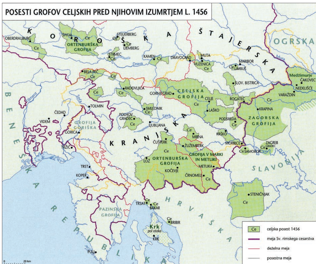
Posesti grofov Celjskih pred njihovim izumrtjem leta 1456 (Slovenski zgodovinski atlas, str. 89).

dvor, čeprav za to nimamo opore v virih. 10 Vse od smrti Ulrikovega sina Viljema (u. 1392), o čigar dvoru ne vemo ničesar, do polnoletnosti Friderika II. (r. ok. 1379, u. 1454) je obstajal samo en dvor, ki ga je vodil oče slednjega, Herman II. (r. ok. 1361, u. 1435), kasneje pa sta svoj dvor imela tudi Friderik II. in njegov sin Ulrik II. (r. ok. 1406, u. 1456). O dvoru drugih dveh sinov Hermana II. – Ludvika (u. 1414) in Hermana III. (u. 1426) – ne vemo ničesar, saj se v virih skoraj ne omenjata.