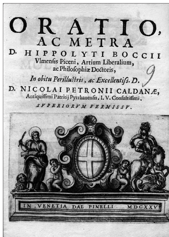
Naslovnica posmrtnega govora ( http://www.dlib.si/details/URN:NBN:SI:DOC-CQL3K9N0 , str. 227).