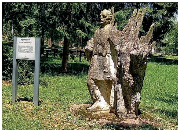
Spomenik Matiji Gubcu v Novem mestu.