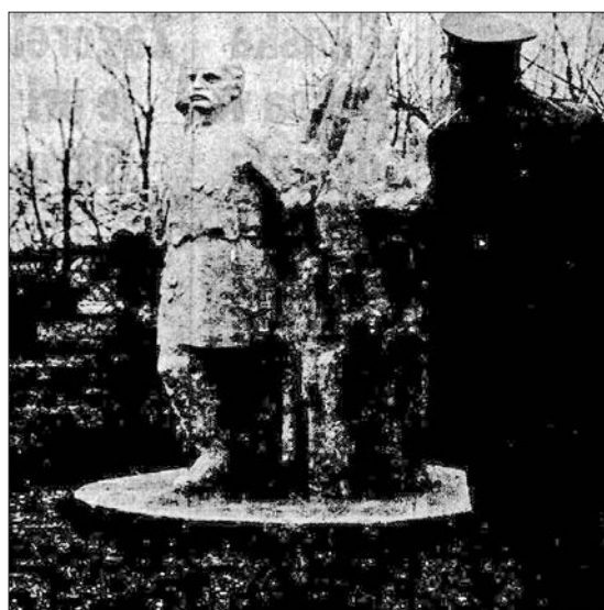
Spomenik Matiji Gubcu v Novem mestu ob odkritju.