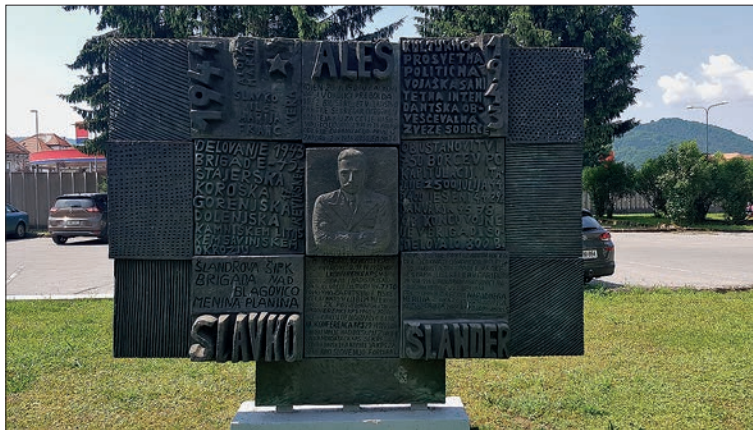
Relief Slavku Šlandru in Šlandrovi brigadi v Celju.