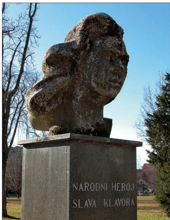
Doprnsni kip Slave Klavora v Mariboru.