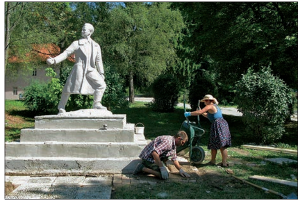
Obnova spomenika Jožeta Gregorčiča v Škofji Loki leta 2012.