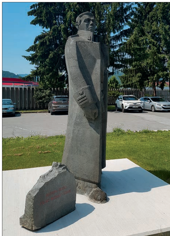
Spomenik Francu Rozmanu Stanetu v Celju.