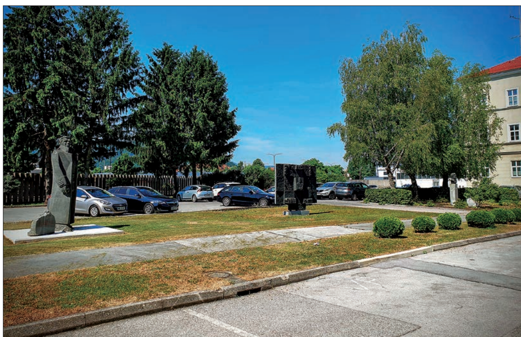
Trije spomeniki v celjski vojašnici.