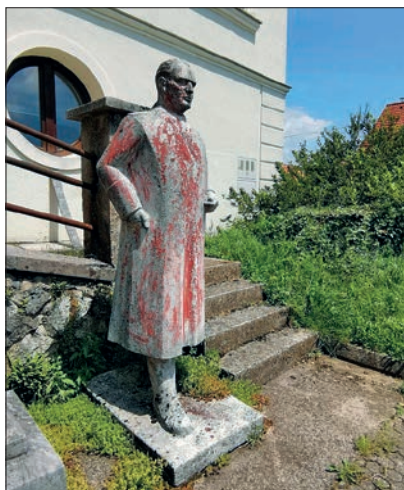
Kip Josipa Broza Tita v Novem mestu danes.