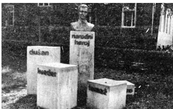
Doprsni kip Dušana Kvedra na Ptujju ob odkritju.