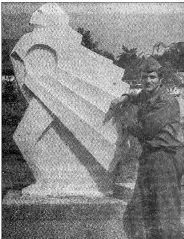
Kip Zmaga na Stari Vrhniki.