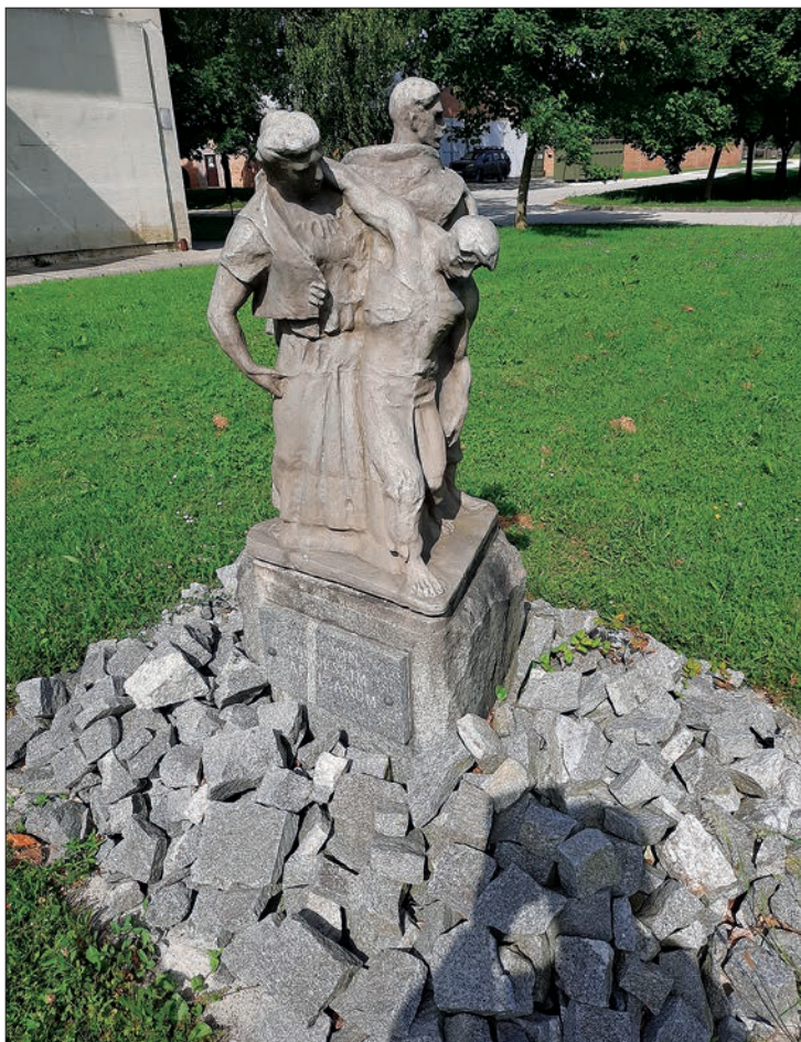
Spomenik pohorskim partizanom v Slovenski Bistrici.