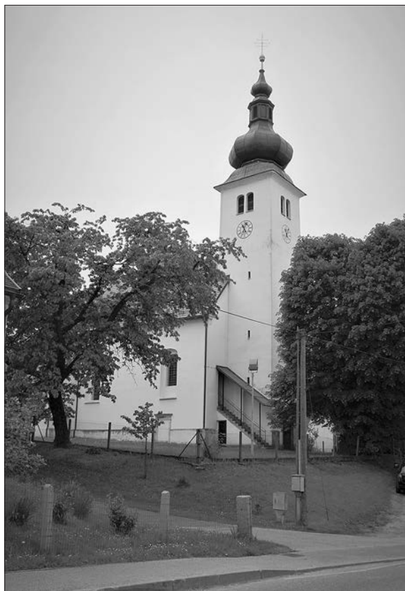
Župnijska cerkev v Cezanjevcih, pogled iz JV smeri.