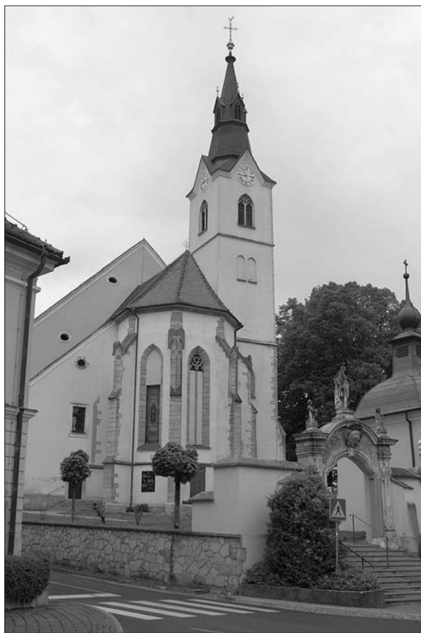
Župnijska cerkev v Ljutomeru, pogled iz JV smeri.