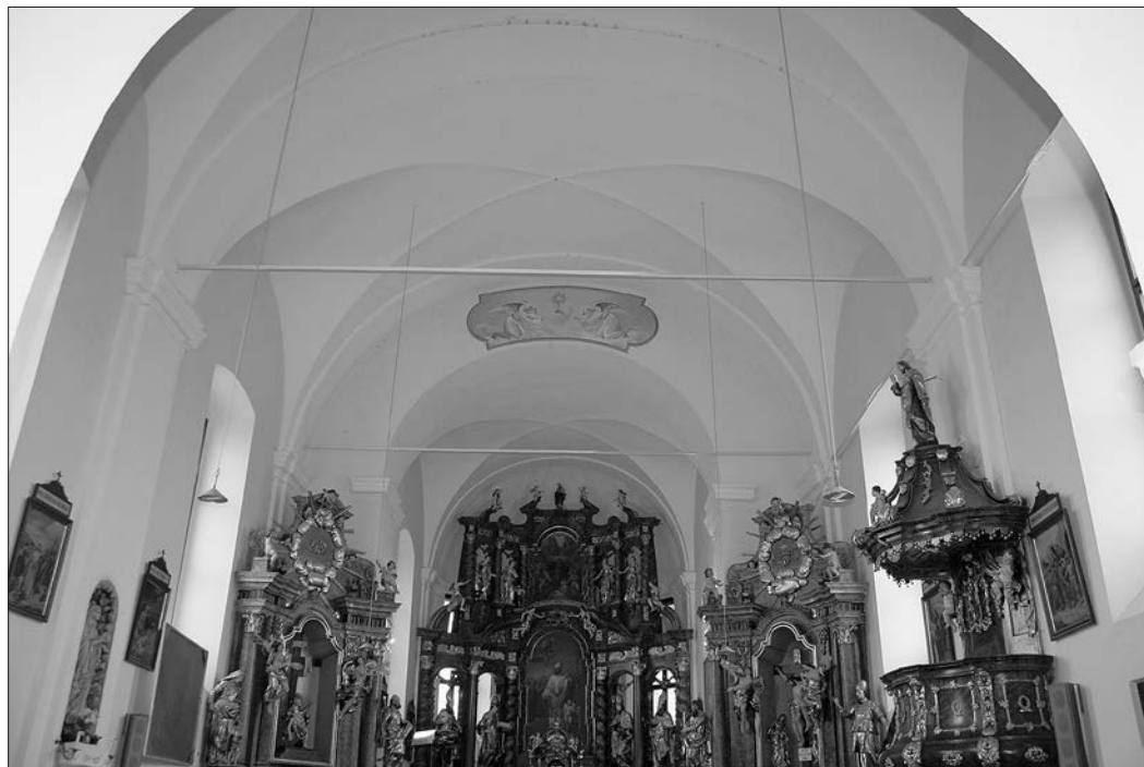
Župnijska cerkev v Miklavžu pri Ormožu, pogled proti glavnemu oltarju.