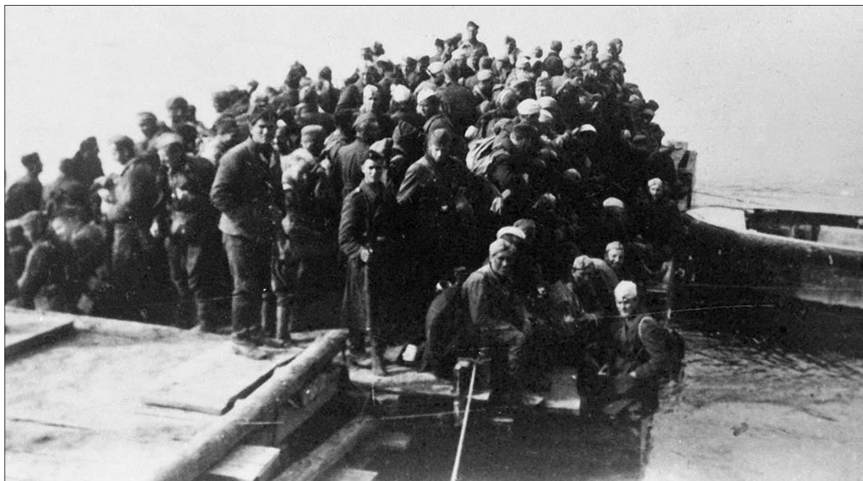
1. prekmurska brigada na prehodu čez Muro, med Mursko Soboto in Ljutomerom.