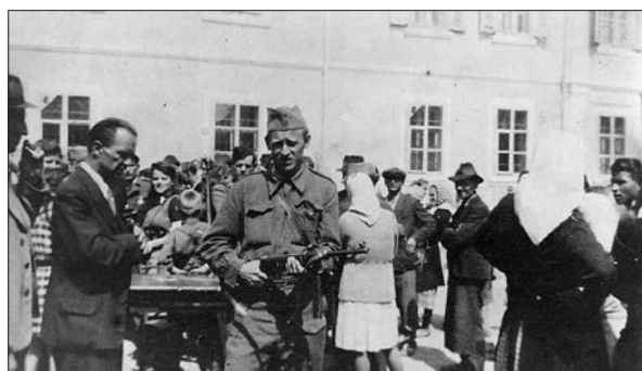
Partizani v osvobojenem Ljutomeru leta 1945.