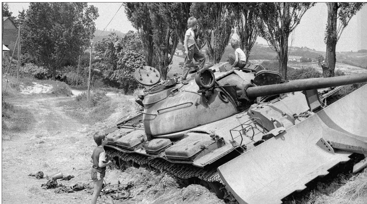
Uničeni tank JLA na Gomili pri Kogu, julij 1991.