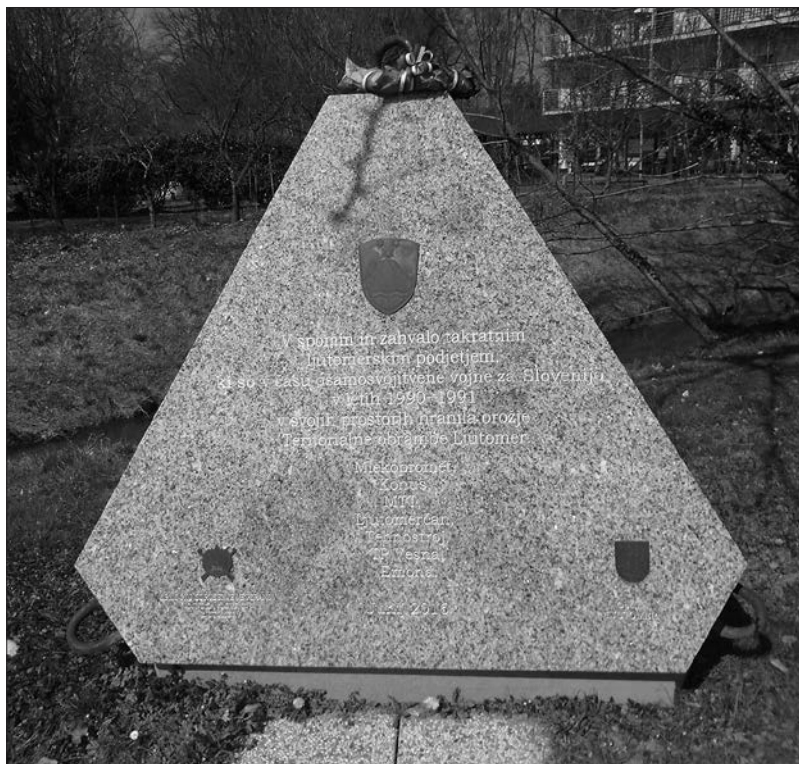
Spominsko obeležje (piramida) na Prešernovi cesti v Ljutomeru.