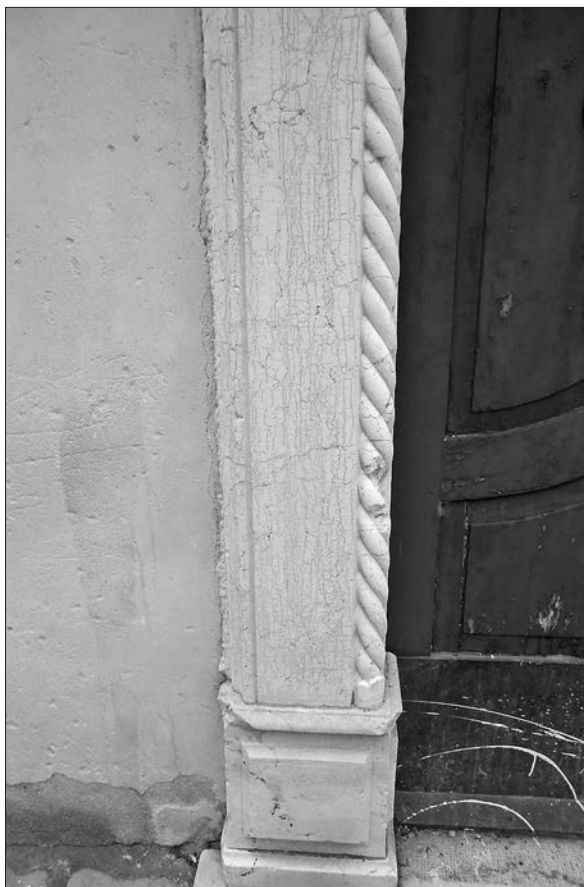
Slika 6: Detajl originalnega gotskega portala na severni steni stolnice.