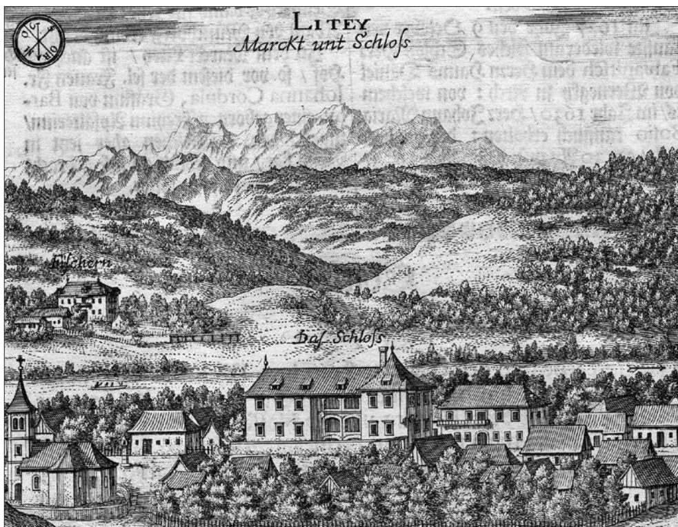
Trg Litija, v središču grafike je dvorec (Valvasor, Die Ehre , XI, str. 343).

Slatni, dobimo vtis, da je bil večji delež predmetov tam bolj shranjen kot namenjen uporabi. V skrinje, ki so bile manj reprezentativne od tistih v Ljubljani, so shranili kositrne skledе, krožnike, steklenice, vrče, veliko tehtnico, pet svečnikov, vrč, slabo stensko uro, šest medeninastih nožev, nekaj oblačil in posteljno perilo. 71 Med slednjim so člani inventurne komisije našli: par rjuh, enajst pernic, žimnico, devet blazin, štiri stare, slabe odeje in tri valencijanke. Predivo, bel dvonitnik in čipke so hranili v omari s predali, skrinji s predali ter še dveh skrinjah, ki sta ju krasila grba družine Barbo. 72 V prostorih na Slatni in v Litiji so bili tudi naslednji kosi pohištva in opreme: štiriin-dvajset usnjenih stolov, naslanjač, pet posteljnih ogrodij, eno izmed njih je bilo izdelano iz trdega, črno luženega lesa, kabinetna omarica iz orehovega lesa, v kateri so bili shranjeni spisi, sedem majhnih mizic, dve preprogi iz damasta in stara španska stena. Komisija je pri pregledu premoženja odkrila tudi sveženj beneških usnjenih špalirjev. 73