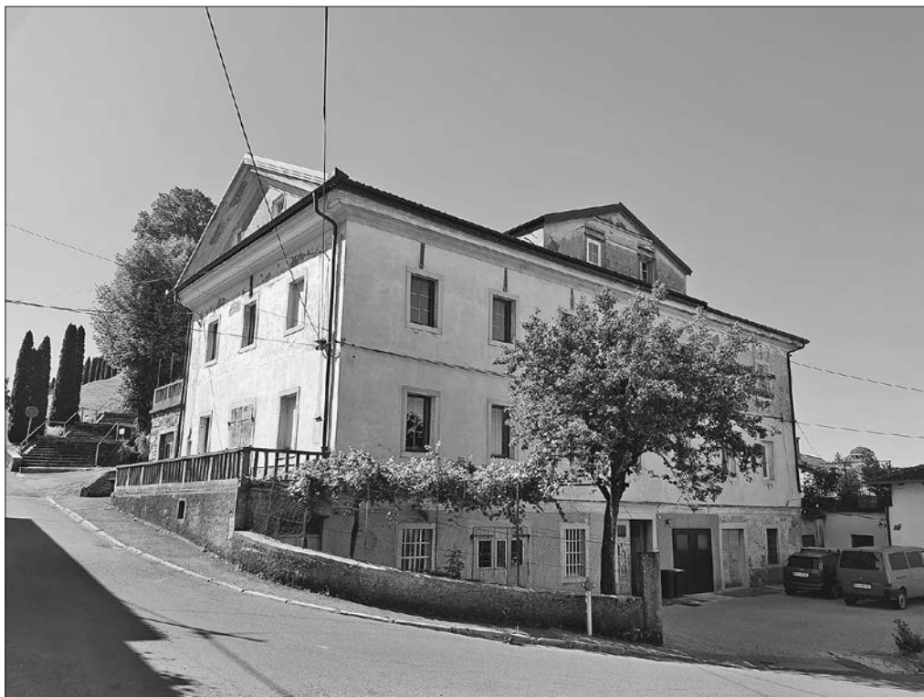
T. i. Jenkova hiša na lokaciji nekdanjega dvorca – Jurčičeva ulica 18.