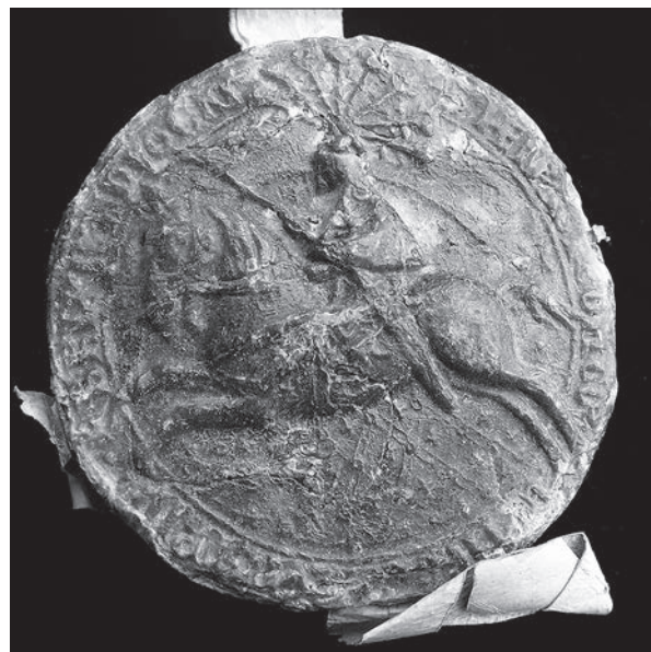
Pečat goriškega grofa Henrika II. (Preinfalk in Bizjak, Turjaška knjiga listin , str. 421, št. 7).