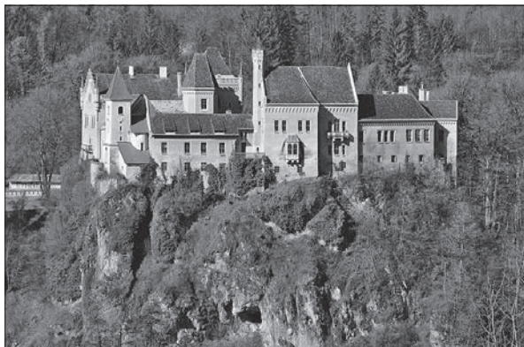
Današnja podoba gradu Eberstein.