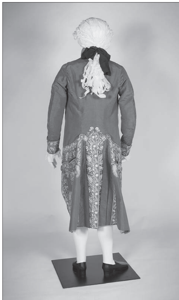
Moška svečana obleka s konca 18. stoletja (last »Fondazione Palazzo Coronini Cronberg, Gorizia«, dovoljenje št. 1003/X.3).