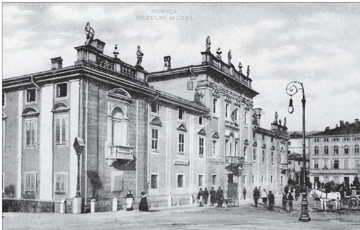
Mestna rezidenca družine Attems Petzenstein v Gorici, od leta 1900 sedež deželnega muzeja.