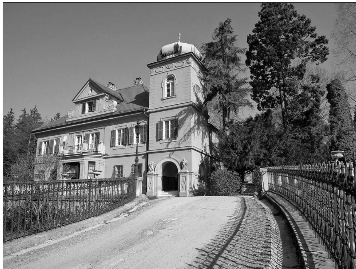
Vhod v dvorec Gutenbüchl.