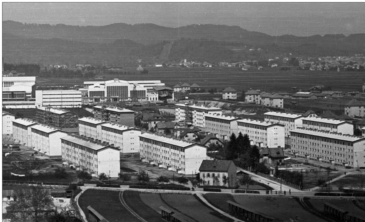
Titovi zavodi Litostroj kot simbol povojne industrializacije Ljubljane ter litostrojski bloki in bloki Mestnega ljudskega odbora, 19. 5. 1950.

mili v Združenih državah Amerike, izpopolnjena pa je bila v Evropi. Montažna gradnja blokov ima v socialističnih državah precej drugačen pomen kot na Zahodu. Na Vzhodu so bili bloki zgrajeni za zgledne socialistične državljane – delavce in družine z otroki. Bloki v zahodnih, kapitalističnih državah pa so bili večinoma namenjeni za priseljence in državljane z nizkimi dohodki ter za reševanje socialne problematike. Dejanska razlika v sicer podobnem razvoju novih stanovanj in drugih tovrstnih gradbenih projektov ni toliko v tem, v kolikšni meri so zgradbe in naselja postala družbeno zaželeni, temveč v reprezentaciji socializma, ki je kot sistem skušal dokazati superiornost nad kapitalizmom v smislu reševanja in graditve stanovanj po vojni.