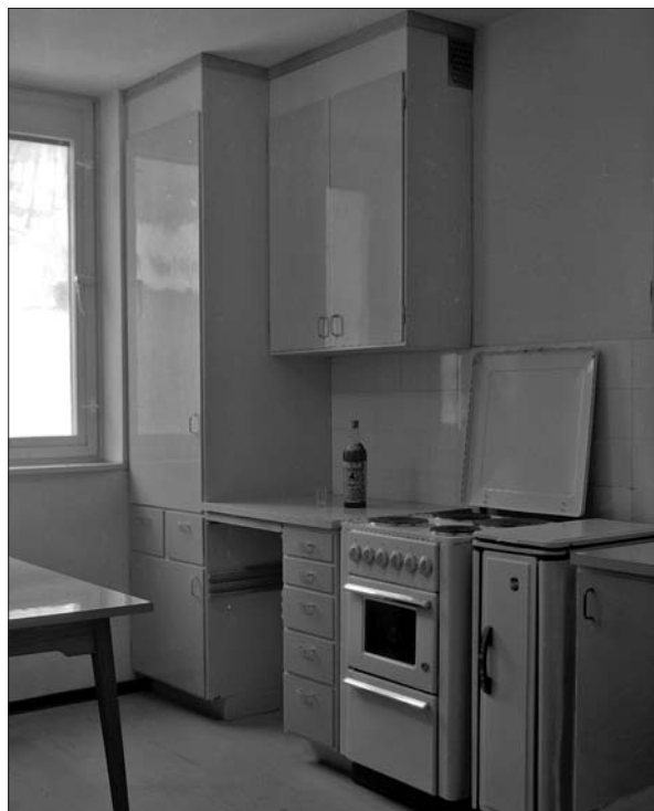
Kuhinje postanejo modernejše z vgradnimi omarami in štedilnikom, januar 1964.

razporeditve prostorov. Na novo grajena stanovanja so bila v primerjavi s starimi udobna, z vsemi potrebnimi prostori: kopalnico s tekočo vodo, straniščem, dnevno sobo, spalnico, kuhinjo (po navadi z jedilnico) in še kakšno sobo. Največ je bilo dvosobnih stanovanj. V dnevnem prostoru je z malo pretiravanja vsaka družina imela radijski sprejemnik, gledanje televizije pa je bilo v šestdesetih letih še »kolektivno«. 107 V kuhinji so dotedanje prostostoječe omare zamenjali vgradni elementi in viseče stenske omare – t. i. švedska kuhinja (na Švedskem prisotna že od leta 1930) s plinskimi in električnimi štedilniki. 108 Standard je postal tudi hladilnik. V spalnici pa je pravo revolucijo naredila t. i. vzmetnica jogi, ki je postala simbol proizvodnje tovarne pohištva iz Nove Gorice Meblo. 109 Osebna poraba v mestu je bila najvišja prav v šestdesetih letih, ko je obsegala največji delež družbenega proizvoda. 110 V tistem času so se plače hitro zviševale; povprečno so se od leta 1960 do 1970 zvišale za šestkrat. Sredi šestdesetih let je povprečna družina za hrano porabila okrog 40 % dohodkov. Z leti se je ta izdatek zmanjševal, kupovanje trajnih dobrin pa se je povečevalo. Ljudje so se bili pripravljeni odpovedati sadju, zelenjavi in mesu ter