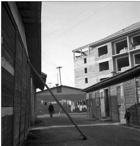
Novih stanovanjskih blokov ponekod niso gradili na nepozidanem zemljišču, temveč so zrasli skorajda sredi barakarskih naselij, ki jih je bila povojna Ljubljana še vedno polna. Mešanje starega z novim, marec 1957 (foto Svetozar Busić, fotografijo hrani Muzej novejšje zgodovine Slovenije).

bljani nastopal Zavod za stanovanjsko izgradnjo. Po letu 1955 so bile ustanovljene prve stanovanjske zadruge, ki niso bile več samo združenja investorjev, ampak »gospodarske organizacije, v katere se združujejo posamezniki in pravne osebe, ki bi ob pomoči družbene skupnosti sezidali hiše in pridobivali stanovanja za svoje potrebe«. 42 Leta 1956 je bilo v Ljubljani že 35 zadrug, leta 1959 pa je njihovo število doseglo 177. Leta 1960 je bil ustanovljen Zavod za združno gradnjo.