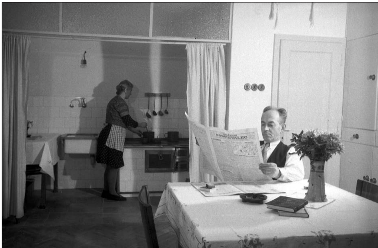
Tipična podoba kuhinje v prvih povojnih letih, 15. 11. 1949.

tantskih organizacijah, so bili v glavnem izdelani po željah investitorjev, brez upoštevanja sodobne stanovanjske kulture, ekonomije in arhitekturne obdelave objekta. Tako je bil en sam tip enodružinske hiše v enem letu in pol v Ljubljani ponovljen 107-krat. Do srede petdesetih let o organizirani individualni gradnji ne moremo govoriti. Konec petdesetih let so bile ustanovljene zadrage, ki so ponujale možnost kvalitetnejše individualne gradnje. Vrstno hišo so v tem času imeli za eno najracionalnejših oblik stanovanjske arhitekture. 63 Praviloma je bila enonadstropna ter dvostransko orientirana na ulico in zasebni vrtiček, s sosednjimi hišicami se je povezovala v ravni liniji ter v prvi vrsti polnila vrzeli sredi sistema vil in individualnih hiš v raznih delih mesta. 64 Prav ta oblika je postala pri nižjih gradnjah vse pogostejša. V drugi polovici petdesetih let so bili pod vplivom sodobne skandinavske arhitekture pri nas uvedeni tudi drugi tipi enodružinske organizirane gradnje s svojimi različnimi kompozicijskimi možnostmi: pritlične hiše, atrijske hiše v obliki črke L, črke U itd. Prelomnico je pomenil natečaj za enodružinsko hišo, ki je bil razpisan vzporedno z razstavo Stanovanje za naše razmere leta 1956. 65 Kljub vsem ekonomskim in oblikovnim