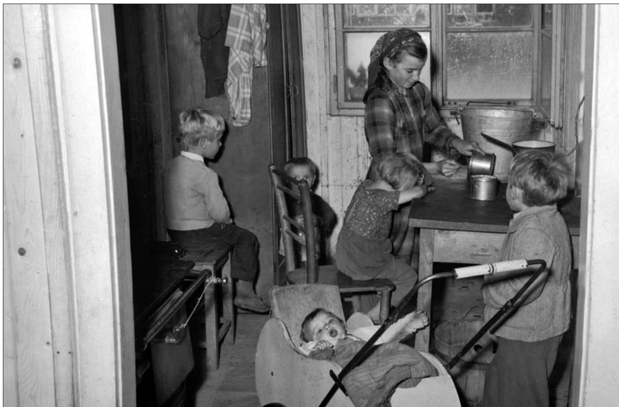
V času pomanjkanja primernih bivalnih enot si je stanovanje ponekod delilo tudi več družin. Delavsko stanovanje v Ljubljani, 1954.