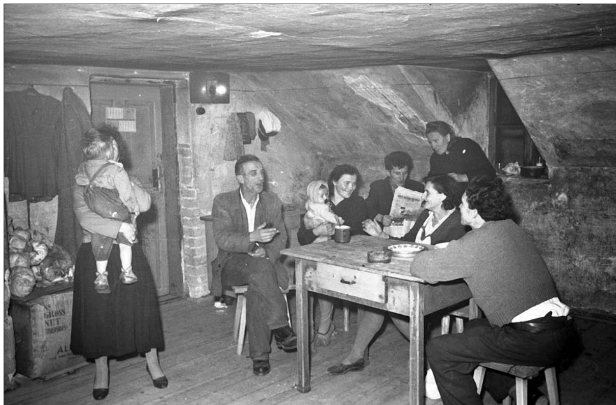
Slabe stanovanjske razmere niso bile značilne le za prva leta po drugi svetovni vojni, temveč ponekod še za petdeseta leta. Družina v iskanju boljših stanovanjskih razmer, november 1957.

je treba vsakemu človeku zagotoviti minimalne stanovanjske razmere. 17 Naseljeni so bili celo gradovi in dvorci, po paroli »raje svoboden in na svojem kot med štirimi stenami« 18 pa so se širila revna predmestja.