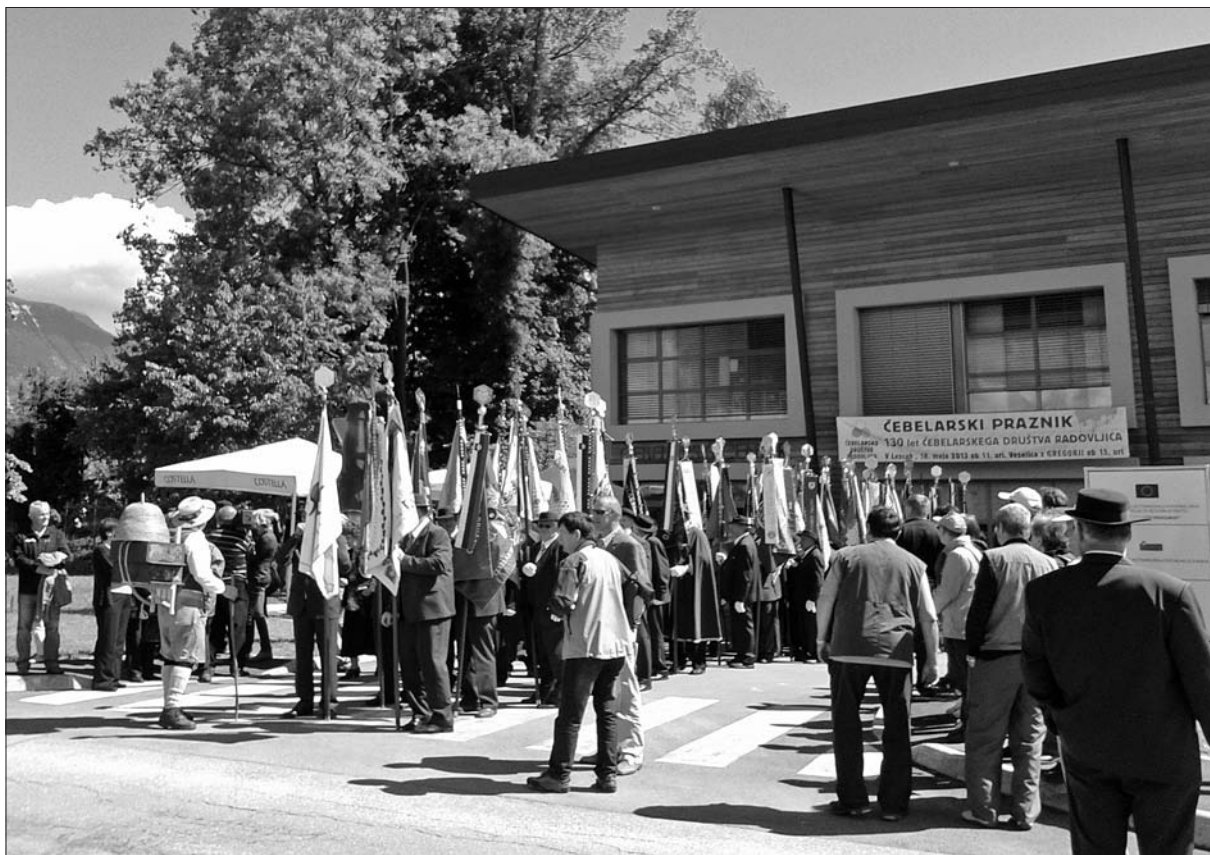
Čebelarski praznik v Lescah ob 130-letnici Čebelarskega društva Radovljica, 2013.

Čebelarska zadruga Radovljica je tako ob koncu leta 1946 združevala 307 članov z 2389 AŽ panji, 2089 kranjčiči in 67 drugimi vrstami panjev v prvotni ideji Rodinske bratovščine iz leta 1781 ter prvega čebelarskega in sadjarskega društva iz leta 1883. Tega leta je zadruga praznovala 100-letnico rojstva Mihaela Ambrožiča iz Mojstrane.