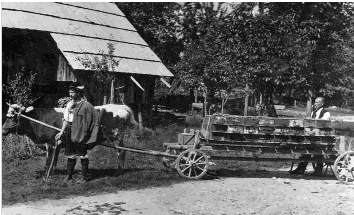
Prevažanje kranjčev na pašo, 15. 8. 1928.

pesnik, duhovnik ter čebelar in čebelarski učitelj, po rodu iz Gorenjske, ki je bil zaradi svojih naprednih nazorov izgnan na Moravsko.