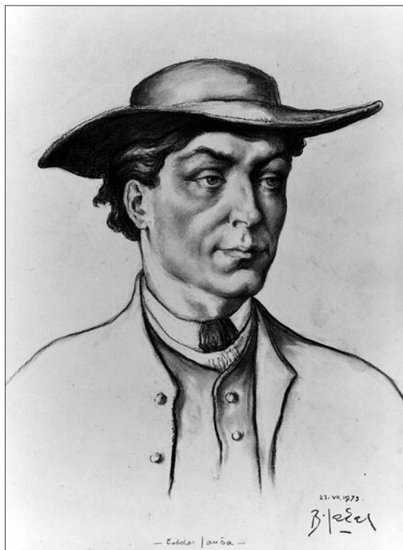
Božidar Jakac: Anton Janša, 1973, risba sephia kreda (brani Čebelarški muzej v Radovljici, inv. št. ČM 1016).

V razsvetljenstvu je širjenje in napredek čebelarstva kot pomembne gospodarske panoge v avstrijski monarhiji spodbujala tudi cesarica Marija Terezija z ustanavljanjem kmetijskih družb in čebelarskih šol. Čebelarstvo je bilo najbolj razvito prav na Kranjskem. Čebelarstvo so s praktičnim delom in čebe-