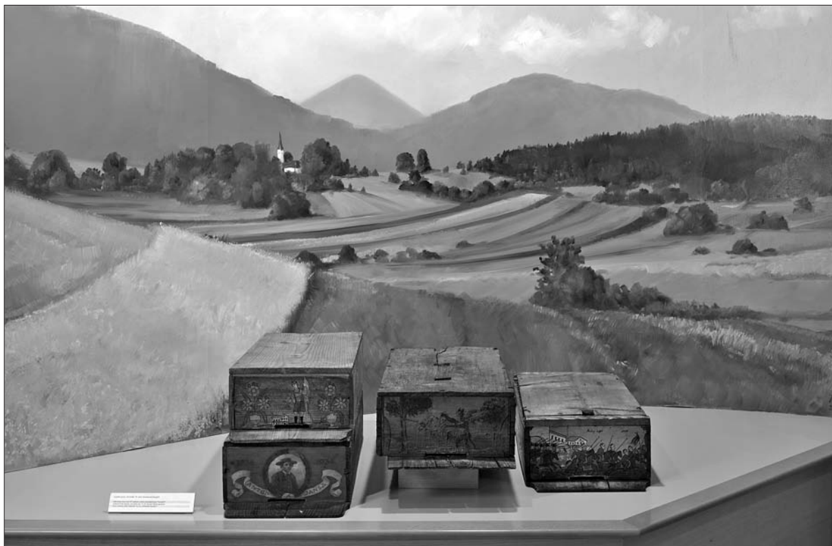
Pogled na kranjske panje »kranjčice« s poslikanimi panjskimi končnicami na stalni razstavi v Čebelarškem muzeju v Radovljici.

ohranjanju »poezije kmetijstva«, kot pravijo gojenju čebel oz. čebelarstvu, kar naj bi pomenilo, da čebel ne gojijo samo zaradi medu in oprasha kmetijskih kultur, temveč preprosto zato, ker jih imajo radi. 71