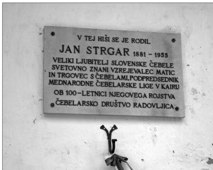
Spominska plošča Janu Strgarju na njegovi rojstni hiši v Bohinju (foto: Tita Porenta, 2016).

Deželi, 11 območju nekdanje radovljiške gosposke, zaradi zelo ugodnih naravnih danosti (sončna lega, dobra paša) dolgo tradicijo. Ker je to območje že od nekdaj kmetijsko, je bilo čebelarstvo zaradi medu, voska in medice donosna postranska gospodarska dejavnost. Čebelarstvo znanje se je praviloma prenašalo iz roda v rod.