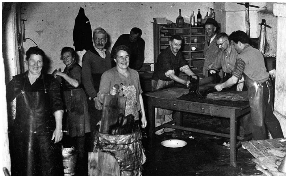
Fotografija satnišnice Čebelarkega društva Radovljica.

v Slovenskem čebelarju objavljeni podatki o občnem zboru in delu podružnice Radovljica. Omenjeno glasilo navaja, da so kupili skupno točilo za med s pripadajočim orodjem in organizirali pet predavanj. V novem-starem odboru so bili predvsem radovljiški posestniki, nadučitelj in župnik. 76