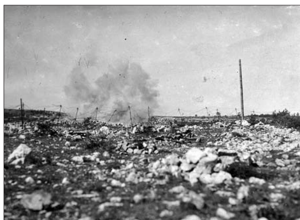
Kraško bojišče med prvo svetovno vojno.