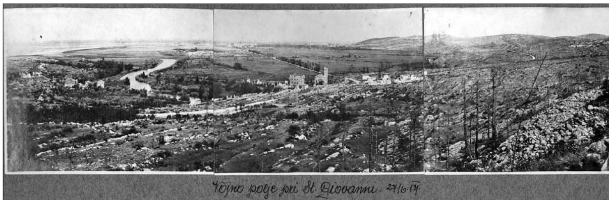
Pogled na bojišče pri Sv. Ivanu poleti 1917.