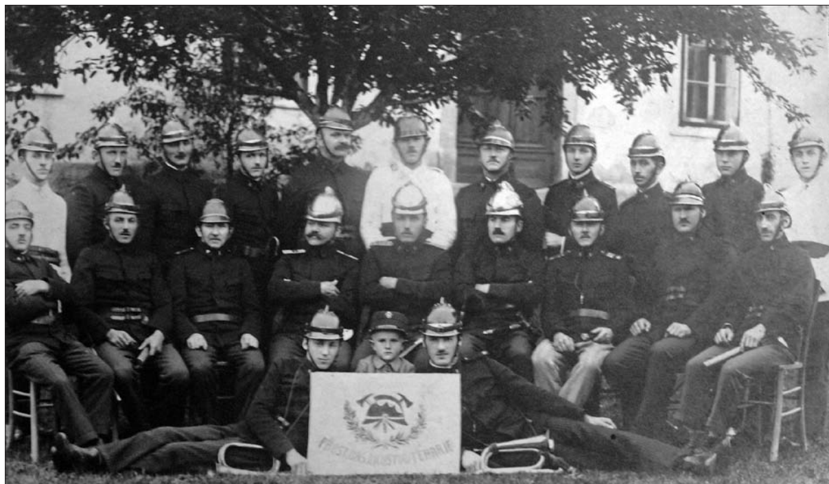
Teharski gasilci leta 1929.