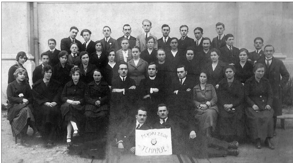
Pevsko društvo Teharje (brani Železarski muzej Štore).