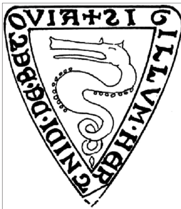
Vurberski grb: črni zmaj z zavitim repom na zlatem polju. Ta grb je prvi uporabil Hartnid I. leta 1246 ( Hajdinjak in Vidmar, Gospodje Ptujski , str. 15).

V rokah gospodov Ptujskih je bilo v 13. stoletju vsaj 14 gradov. 25 Friderik V. je v času ogrske vlade na Štajerskem leta 1255 opravljal funkcijo deželnega maršala in se že konec leta pred tem obnašal kot nekakšen štajerski deželni funkcionar, ko je skupaj z gospodom Gotfridom II. Mariborskim in še nekaterimi drugimi plemiči šibkejšega Vernerja Hompoškega prisilil, da je plačal odškodnino vetrinjskim