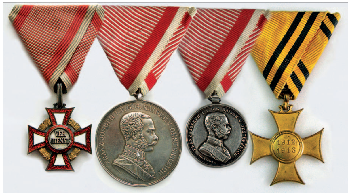
Portret Mihaela Gabrijelčiča in odlikovanja, kakršna je prejel.

Oberleutnant im k. u. k. Infanterie-Regiment Nr. 24 Besitzer des Eisernen Kronen-Ordens III. Klasse mit der Kriegsdekoration, des Militär-Verdienstkreuzes III. Klasse mit der Kriegsdekoration, der Silbernen Tapferkeitsmedaille I. und II. Klasse gefallen am 25. Mai 1916 bei einem Sturmangriffe am Berge Civaron in Südtirol.