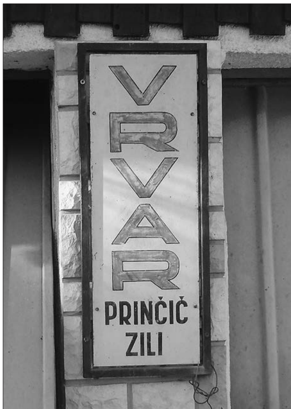
Ohranjena reklamna tabla Bazilija Prinčiča (brani: SIKLJT, OE Muzej).

Na območju Ljutomeru je bilo mizarstvo številčno zastopano in bolj razvito v zgodnjem novem veku, ko so bili ljutomerski mizarji del radgonskega ceha. V prvi polovici 18. stoletja sta ljutomerske tržane oskrbovala dva mizarja. Sto let pozneje pa se je število mizarjev povečalo na tri. 69 Mizarstva obrt je svoj razvojni višek dosegla konec 19. stoletja. Ljutomer-