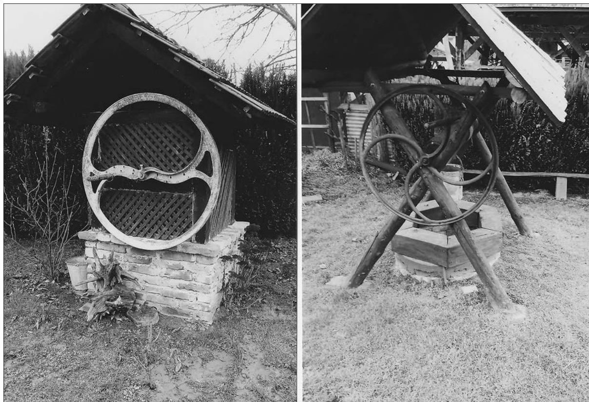
Obranjena studenca na Šafarskem (hrani: SIKLJT, OE Muzej)

še leseno ostrešje za zaščito pred raznimi tujki, ki bi lahko padli v vodnjak in onesnažili vodo. 62