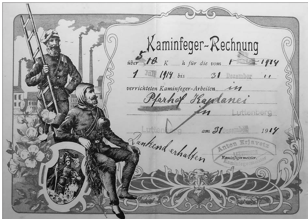
Račun za dimnikarske storitve ljutomerskega dimnikarja Antona Erjavca iz leta 1914 (arhiv Župnije Ljutomer).