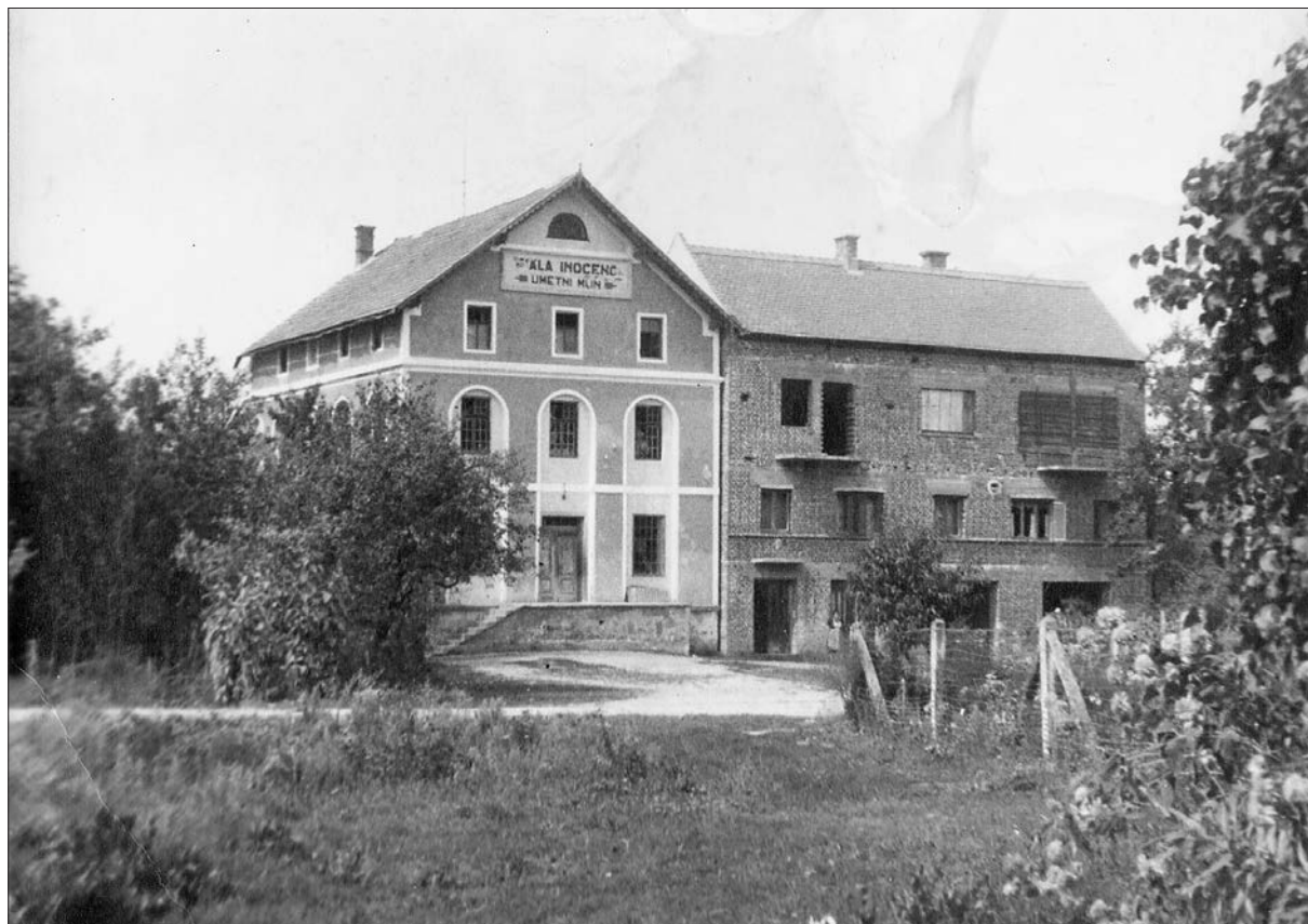
Mlin na Razkrižju leta 1954 (hrani: SIKLJT, OE Muzej).

in podpornika Sokola izgnali v Ljubljano. Po koncu vojne se je vrnil v domači Ljutomer, kjer je leta 1950 odprl slaščičarno. Otroci so najraje jedli velike medenjake, odrasli pa predvsem slastne vinske kekse. Njihovo tradicionalno lectarsko pecivo ni manjkalo na sejnih in prošenjih po Prlekiji in Prekmurju.