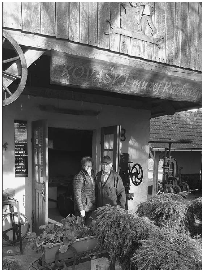
Kovaški in kolarski muzej družine Horvat na Razkrižju (hrani: SIKLJT, OE Muzej).

v radiju petih kilometrov, pridružiti Ljutomerskemu cehu. 36