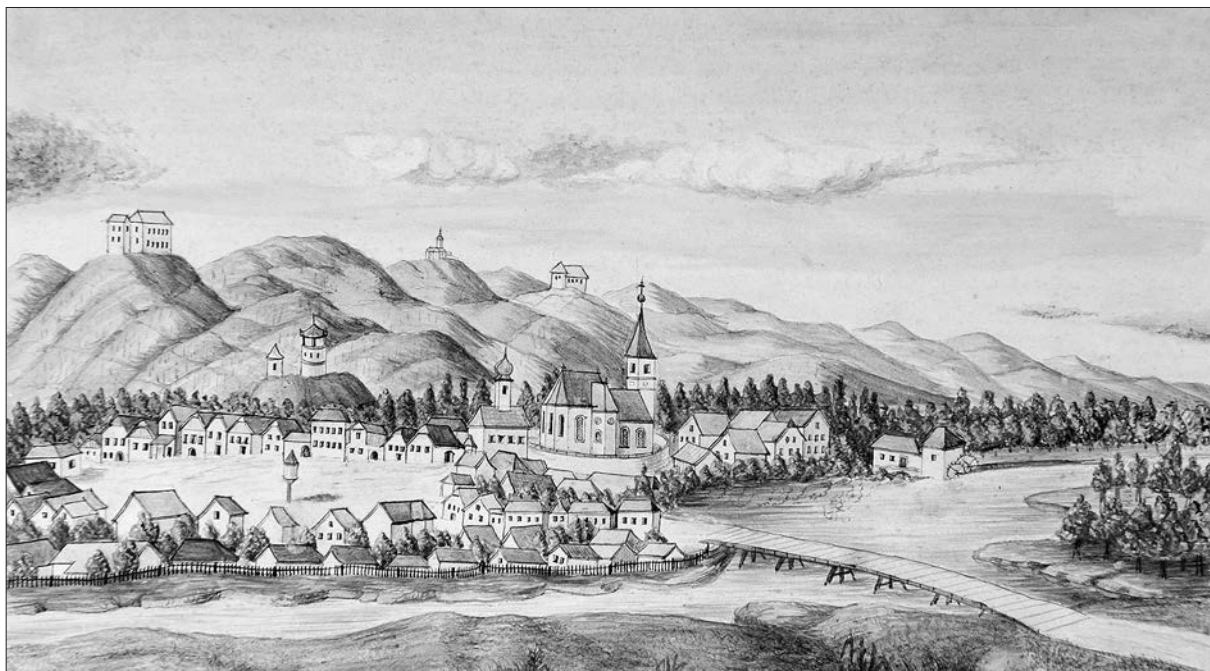
Trg Ljutomer leta 1681 (Slekovec, Trg in župnija Ljutomer, str. 5).

dno živečih nekaj poznavalcev starih obrti in njihovih potomcev, ki ohranjajo to znanje in ga prenašajo mlajšim generacijam.