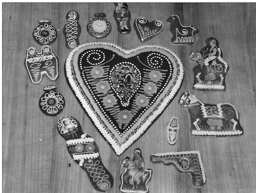
Razni lectarski izdelki slašičičarne Škrajnar iz Ljutomera (hrani: SIKLJT, OE Muzej)