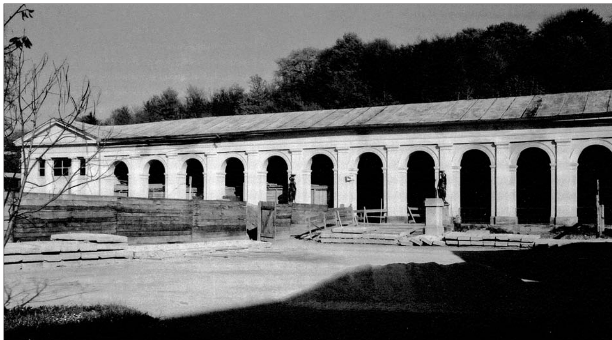
Pokrito sprehajališče, wandelbahn, v Zdravilišču Rogaska Slatina v začetku 60. let 20. stoletja. Takrat je zdravilišče dobivalo povsem novo podobo, kjer ni bilo več mesta za wandelbahn iz leta 1843 (vir: arhiv ZVKD Slovenije, območna enota Celje, foto: Roman Fonda, 1963).

ren drugemu sodobno preobraženemu zdraviliškemu jedru, kjer so v šestdesetih letih 20. stoletja postavljali armiranobetonske zgradbe z imeni Terapija, Hotel Donat, Pivnica, Hotel Sava in druge. V nekaj letih je zdravilišče dobilo povsem novo, moderno podobo, ki so se ji morali umakniti omenjeni wandelbahn , zdraviliška vrtnarija, mostički in nekatere poti, že leta 1953 pa tudi izvirska mineralna voda Tempel, ki je do gradbenega posega v tla zdraviliškega jedra vrela