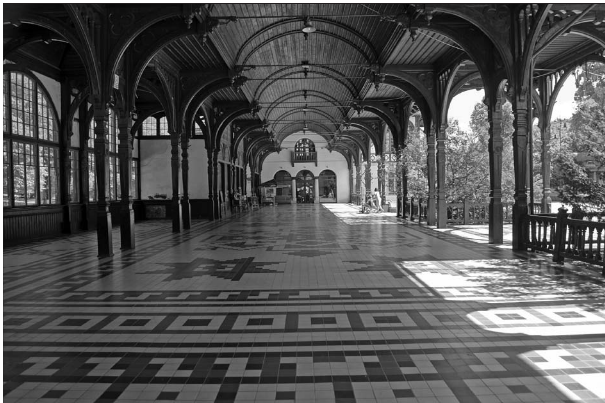
Szczawno-Zdrój, wandelbahn iz leta 1893.