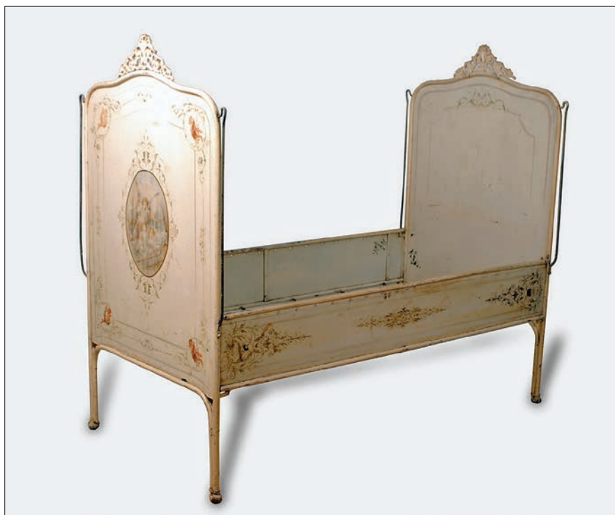
J. & L. Quittner, otroška postelja, zgodnje 20. stoletje (POMUM inv. št. N. 13322).