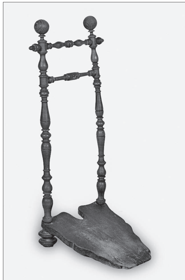
Pripomoček za sezuvanje obutve, 19.–20. stoletje (POMUM inv. št. N. 10185).