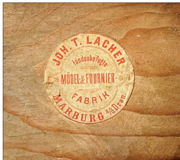
Papirnata nalepka: »JOH. T. LACHER landesbefugte MÖBEL & FOURNIER FABRIK MARBURG a/d Drau«.

V mariborski muzejski zbirki pohištva je ohranjeno zgolj eno Lacherjevo delo. Historistična vitrinska omara 23 iz okoli leta 1880 je pravokotnega tlorisa in stoji na štirih nogah v obliki sploščenih krogel. Podnožje omare je profilirano, zaboj ima spredaj porezane in nažlebljene vogale. V spodnji del zaboja sta nameščena dva ozka predala z ovalnima nalimkoma. Nad predala so postavljene tri zastekljene stranice. Višino steklenih površin vseh treh stranic zmanjšujejo horizontalne letve. Sprednja stranica služi kot enokrillna vrata. Prekrov omare je oblikovan kot obok s profiliranim zaključkom. Na čelu oboka je rezbarjena krona z voluto v sredini, z dvema svitkoma ob straneh in s prepletenim cvetličnim motivom. Notranjost je oblepljena z zelenim plišem, v zgornji tretjini je čez celotno širino hrbta nameščena opora za puške, kar priča o tem, da je bila vitrina namenjena shranjevanju orožja. Na zunanjem delu hrbta omare je papirnata nalepka »JOH. T. LACHER landesbefugte MÖBEL & FOURNIER FABRIK MARBURG a/d Drau«. Zraven je ostanek papirnate nalepke, na kateri lahko preberemo besedi