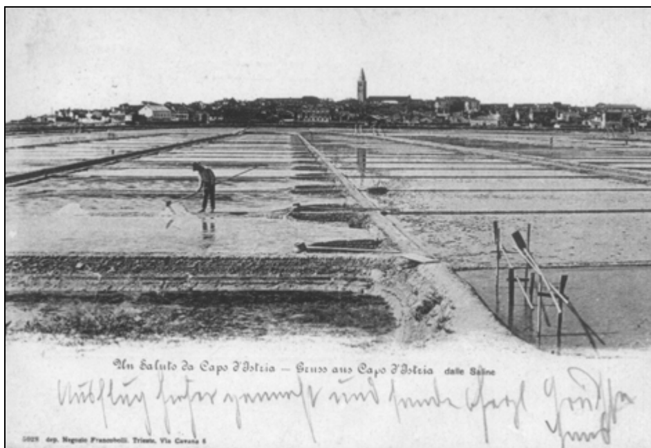
Veduta Kopra s semedelskimi solinami 31.

in tudi začetek pobiranja soli. 32 Prav tako je bilo določeno, da se noben solinar ni smel pod kaznijo 100 solidov muditi na svojem ali tujem solnem fondu pred sončnim vzhodom ali po sončnem zahodu . 33 Solinarji ali lastniki solnih fondov tudi niso smeli po svoji lastni presoji pobirati soli. Statut je tako določal, da si nihče 34 ni smel drzniti na solnih površinah pobirati soli preden je bilo to zabeleženo pri lastniku solin ali občinskemu uradniku (domino salinarum) in dacarju, ter je bil zapisan dan, ko je solinar hotel pobirati sol. Prav tako ni smel noben kupec ali upnik prej dobiti soli, preden je bilo to zabeleženo pri solinarju, lastniku solin ter dacarju in kdorkoli bi naredil drugače, bi vsakič plačal kazen 100 malih denarjev, in sicer polovico komuni in polovico prijavitelju . 35 Nadzorovano je bilo tudi delo na solnih fondih. 36 Z odlokom je bilo določeno, da kdorkoli je imel v najemu komunske soline in že dve leti ni delal soli ali ni opravljal del, naj jih vrne nazaj . 37