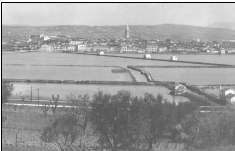
Pogled na opuščene koprskie soline v začetku 20. stoletja.

mož, ki jih plačuje koprška davčna blagajna, ter izvzeli eno od dolgih, počasnih ladij, ki jim majhne ladje, ki tihotapijo sol, zlahka uidejo. Ker so v Svetu desetih že leta 1573 sprejeli sklep o oprostitvi prijaviteljev tatov, je podestat predlagal, naj bi oprostiti tudi tihotapce soli, ki bi prijavili tihotapljenje. V koprskih solinah so tega leta pobrali okoli 4.000 modijev soli, na kmetijskih površinah pa pridelali okoli 20.000 urn 73 vina in 4.000 urn olja. 74