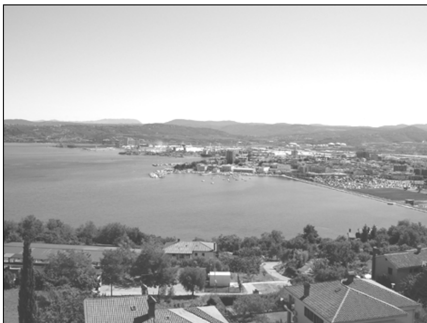
Panorama Kopra leta 2005.

bilo zaradi pomanjkanja skladiščnih prostorov potrebno, tako kot v preteklih dveh sezonah, ko je bilo veliko soli, staro sol metati v morje). 127