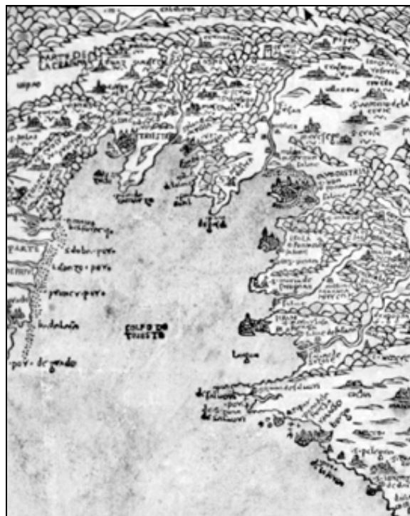
Razširjenost solin ob istrski obali leta 1525 (PMSMP, inv. št. 1002307, Pietro Coppo, De summa totius orbis, Le "Tabvla", Tav. V, L'Istria).

bile koprške soline pomembne zlasti zaradi trgovanja s soljo s cesarskimi deželami. Na današnjem italijanskem delu istrskega polotoka so bile ob izlivu Osapske reke razširjene miljske soline (nekoč beneški del Istre), ob Rosandri pa žaveljske soline (bile so pod cesarstvom, kamor so severozahodno od Trsta sodile tudi manjše škedenjske soline).