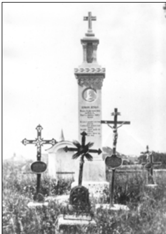
Jenkov nagrobni spomenik v Kranju, fotografija iz leta 1875.

Odkritje spomenika 28. septembra 1873 je v Slovenskem narodu opisal Fran Levce (1846–1916). Na slovesnost je z jutranjim vlakom prispelo 300 gostov iz Ljubljane, ki jih je slavnostni odbor prijazno sprejel. Pripravljali odbor za Jenkov spomenik je uredil, da so se gostje, med katerimi so bili predstavniki Sokola, pisateljskega društva in pevskega društva ljubljanske čitalnice, med 26. in 30. septembrom po Rudolfovi in južni železnici v Kranj lahko pripeljali po znižani ceni. 28 Izkaznice za vožnjo so bile na voljo v narodnih društvih, v čitalnicah in pri znanih rodoljubih. 29