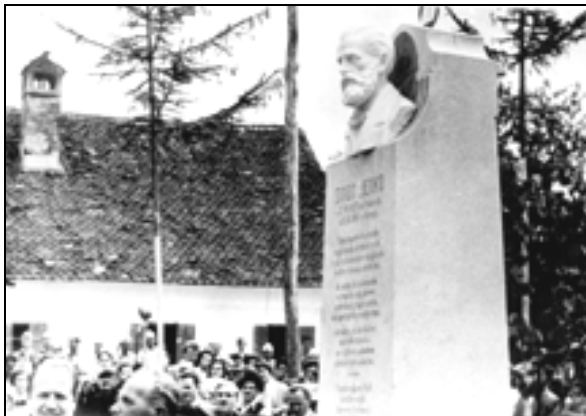
Odkritje obnovljenega Jenkovega spomenika v Podreči, 12. junij 1955.

krili 12. junija 1955 v sklopu proslav 10-letnice osvoboditve, 120-letnice rojstva Simona Jenka in občinskega praznika, ki sta jih priredila Odbor Socialistične zveze delovnega ljudstva in Kulturno umetniško društvo "Simon Jenko" v Mavčičah. Napis ob vznožju spomenika: "Obnovljeno ob 120 letnici SZDL."