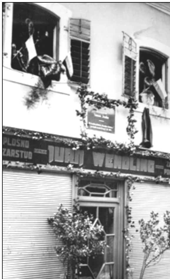
Jenkova hiša v Kranju s spominsko ploščo.

2. septembra ob 8. uri zjutraj je bil sprejem gostov na kolodvoru. Prisotna je bila železničarska godba, "ki je potem ves dan marljivo svirala". Državne železnice so dovolile vožnjo po polovični ceni. 59 Prireditelji so bili nekoliko razočarani, saj Ljubljančani niso prišli v pričakovanem številu. "Morda jih je oplašilo slabo vreme, deloma pa jih je gotovo zadržala tudi mlačnost za kulturne prireditve." 60 Gostov iz Ljubljane niso privabile niti "atrakcije", napovedane za veselico v Narodnem domu, npr. "pravi ameriški bar s plesalkami". 61