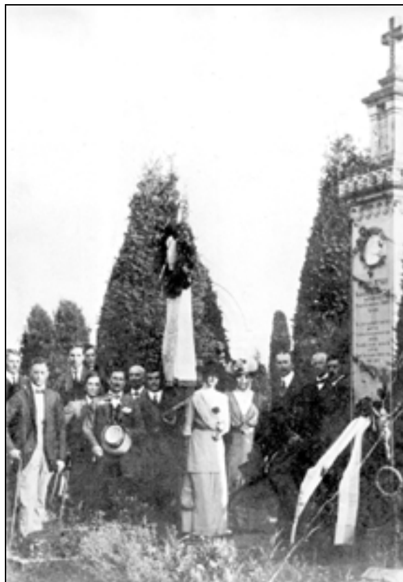
Jenkov nagrobni spomenik v Kranju, fotografija iz leta 1912.

Jenkov spomenik ("ponosen štirioglat steber iz granita") 39 je zasnovan v obliki znamenja. Tovrstna oblika "stebra s tabernakeljsko razširjeno glavo" je znana od srednjega veka dalje, z njo so se likovni dosežki povezovali z ljudskim in verskim čustvanjem. 40 Navezuje se tudi na umetniško zasnovane nagrobnike, kot sta bila nagrobnika Matije Čo-