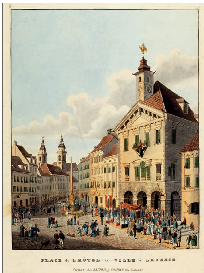
Procesija pred mestno hišo v Ljubljani na velikonočno soboto 1821 (arhiv NMS, foto: Tomaž Lauko).