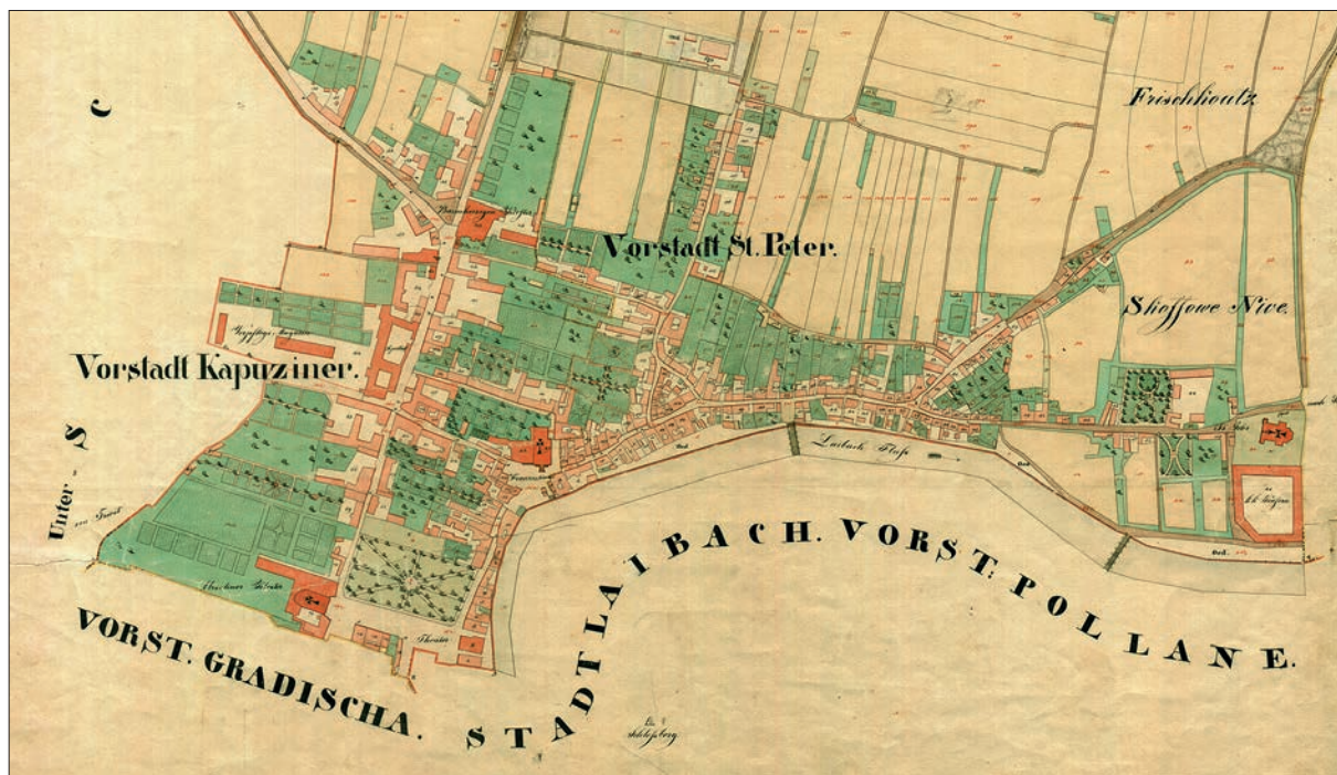
Izsek iz katastrske mape Šentpetersko in Kapucinsko predmestje (SI AS 176, Franciscejski kataster za Kranjsko, L 193, mapni list III, 1825).

niso prepoznavne. Srečamo pa na primer stanovanjska poslopja, obarvana tako z rdečo kot rumeno, pri katerih je rumeni del manjši in torej ponazarja leseno pritliklino zidanemu poslopju. 32 Problem je tudi opisna delitev na stanovanjska in gospodarska poslopja, saj zakrije vmesne tipe stavb, ki so jih uporabljali tako za stanovanje kot za gospodarsko dejavnost (hlev, delavnica, trgovina). Da je določena stavba služila obema namenoma, je nedvoumno izpričano le v primerih, ko je stavbna parcela v zapisniku opredeljena kot stanovanjska in gospodarska zgradba ( Wohn- und Wirtschaftsgebäude ), mapa pa prikazuje en sam objekt. V hišah so zlasti v meščanskih naseljih potekale različne neagrarne dejavnosti, a kataster o tem praviloma molči. Obrtne delavnice in trgovski lokali so sicer posredno izpričani v primerih, ko je v rubriki Stan naveden lastnikov poklic, zelo malo pa je neposrednih omemb gospodarskih delov hiš. V zvezi z namembnostjo stavb se torej poraja cela vrsta vprašanj, največkrat seveda, ko želimo od katastra izvedeti konkretna dejstva o posameznem objektu. Kot smo videli, so nekateri manj pomembni objekti vrisani samo na mapah, bodisi na zemljiških bodisi na stavbnih parcelah, ničesar pa ni o njih mogoče najti v zapisnikih. 33