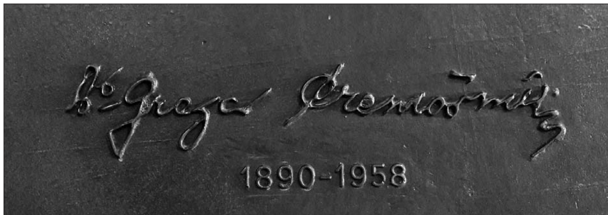
Čremošnikov podpis na spominski plošči na obeležju umrlih profesorjev na Oddelku za zgodovino Filozofske fakultete Univerze v Ljubljani.

oddelka za zgodovino Filozofske fakultete v prvem nadstropju stavbe na Aškerčevi 2 v Ljubljani pa ga bo njegov podpis ohranjal v zavesti še nadaljnjim rodovom študirajočih zgodovinarjev.